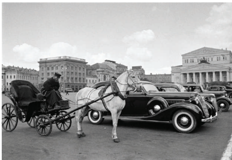
Когда-то было так...

Данная статья подготовлена на основании материалов, имеющих в открытом доступе в сети Интернет, и имеет целью на страницах журнала «Строительная Орбита» пригласить специалистов к обсуждению проблем, с которыми могут столкнуться российские проектировщики при введении требования обязательного применения BIM-технологий при госзаказах. Тем более, что в дальнейшем и частные заказчики, вероятно, также станут требовать применения BIM при проектировании. В статье коротко рассмотрен мировой опыт развития BIM, дается оценка развития нормативной базы по BIM в России и делается несколько предварительных выводов