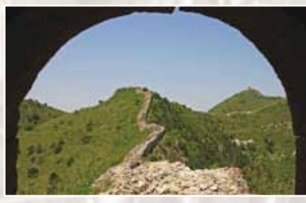
Разрушенные участки Великой Китайской стены. Или дороги с площадками?

Перевалочные базы для дирижаблей были подготовлены на площадках гор Урала, площадках будущей Великой Китайской стены, плато Наска в Перу, на побережье Гамбии (древняя каменная взлетно-посадочная полоса) и, вероятно, в ряде других мест.