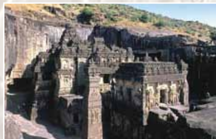
Храм Кайлаш, выполненный из цельного массива скалы. Эллора, Индия

Монолитные и сборные каменные конструкции стали основой строительства зданий и сооружений в древнем государстве (мастабы, пирамиды, храмы, дворцы, дороги, водоводы и многое другое).