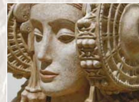
Фрагмент каменного бюста «Дама из Эльче». Лувр. Франция

Говоря о древней радиосвязи, в качестве примера можно привести «загадочную незнакомку» в наушниках – каменный бюст «дамы из Эльче», находящийся в Лувре (Париж). По мнению автора, это изображение женщины, наслаждающейся музыкой из наушников. Правда, наушники-«ракушки» несколько великоваты по сравнению с современными. Но ведь этот бюст был сделан много тысячелетий назад.