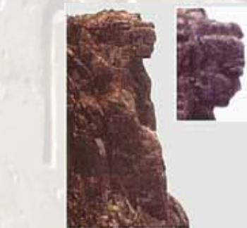
140-метровая «статуя женщины» на скале в Гвинее

Одной из причин исчезновения древнего высокоразвитого государства в Средиземноморье, является версия о столкновении Земли с кометой примерно 13 тысяч лет назад. В 2015 году американские ученые Венди Вольфбах и Джеймс Кеннет из Калифорнийского университета обнаружили, что слои грунта возрастом в 12 800 лет в Гренландии, Северной и Южной Америке, и Европе содержат наноалмазы (алмазы диаметром меньше микрометра). Наноалмазы образуются из частиц углерода при высоком давлении и температуре выше 1800 градусов Цельсия. Такая температура достигается или при