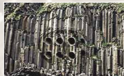
Находка на горе Байгуншань в Китае

В 1996 году исследователи обнаружили на горе Байгуншань в Китае остатки древних металлических труб диаметром около двух метров. По мнению автора данной книги, находка представляет из себя характерный поперечный разрез дирижабля с двойной оболочкой и с системой металлических газовых баллонов.