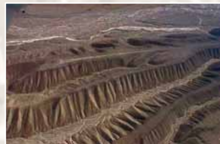
Участок плато Пальпа с промышленными «хвостами». Перу

Существует легенда, что американский профессор Дж. Роберт Оппенгеймер, являющийся одним из разработчиков атомной бомбы, во время ее испытания цитировал описание последствий применения грозного оружия из древнеиндийской «Махабхараты». Последствия испытаний атомной бомбы точно описывались этим древним документом, насчитывающим несколько тысячелетий.