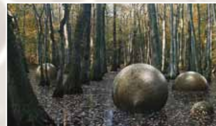
Загадочные каменные шары в джунглях Коста-Рики

Теперь скажем и о загадочных каменных шарах различного диаметра весом от 1 до 10 тонн и более, скопления которых находят по всей планете. По-видимому, это обычный балласт для дирижаблей.