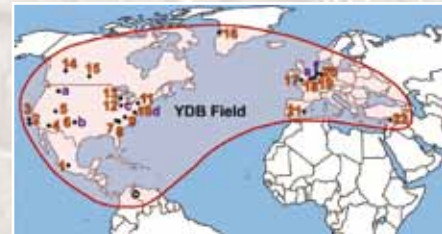
Схема распределения наноалмазов в грунте возрастом 12800 лет

ядерном взрыве, или при столкновении Земли с астероидом или кометой.