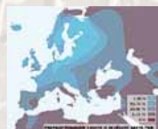
Карта распространения людей со светлыми глазами в современной Европе*

бует дальнейшего исследования. Это государство было основано людьми, использовавшими в древности естественные пещеры для своего существования. Вследствие недостатка солнечного света в пещерах, у людей произошла мутация цвета глаз – глаза стали голубыми, а кожа приобрела белый цвет.