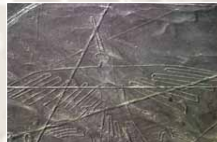
Плато Наска. Перу